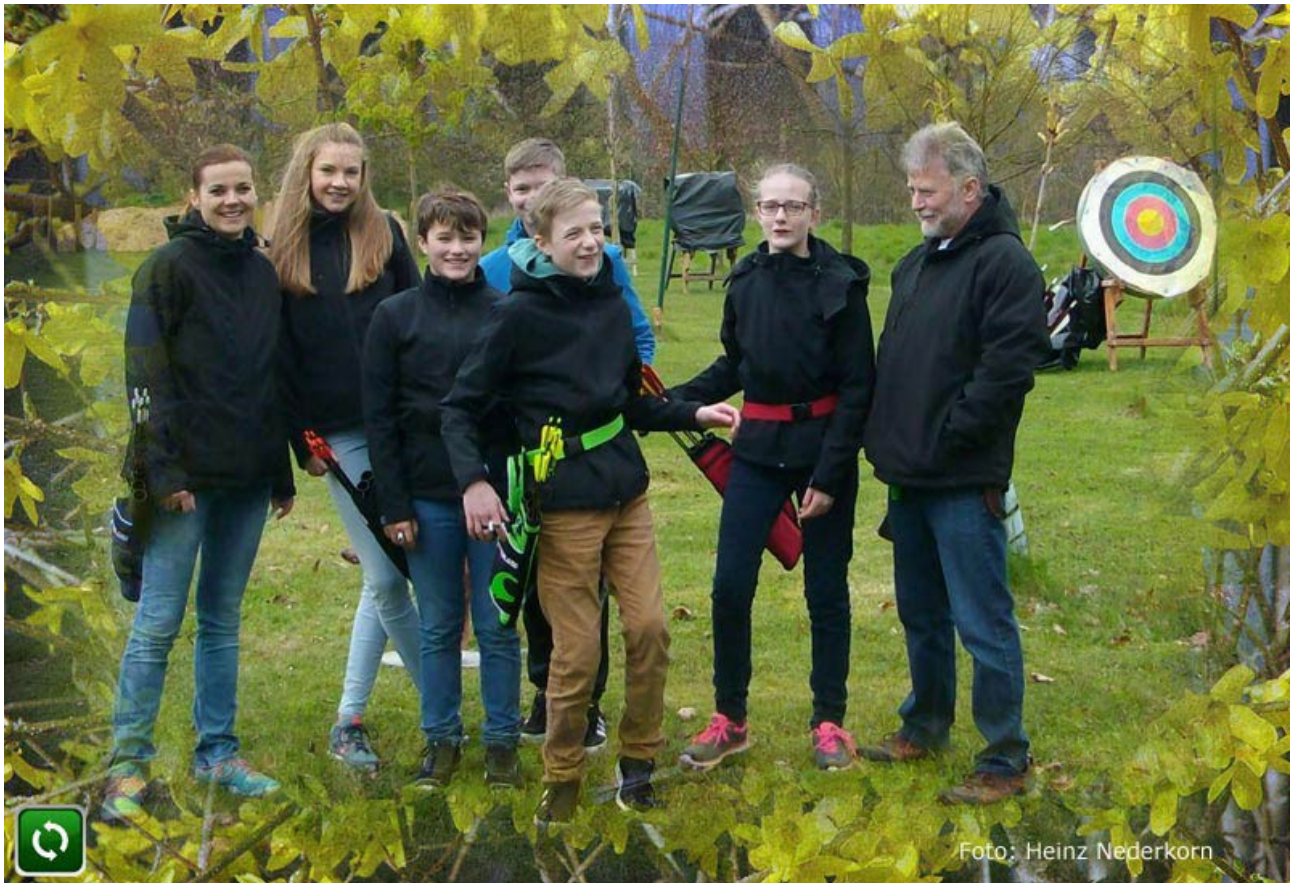
Fotoshooting mit unseren Bogenstars