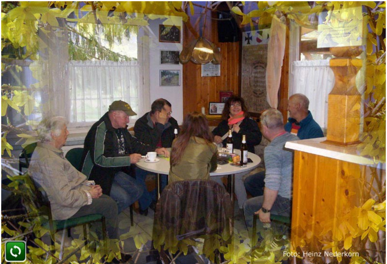
Ein Pläuschchen in Ehren, kann niemand verwehren ;o)